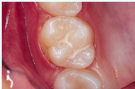
Schutz vor Karies: Versiegelung der feinen Grübchen auf der Kaufläche

Bei der Versiegelung werden die Fissuren mit einem hellen Kunststoff dauerhaft verschlossen, so dass an diesen Stellen keine Karies mehr entstehen kann (siehe Abb. unten).