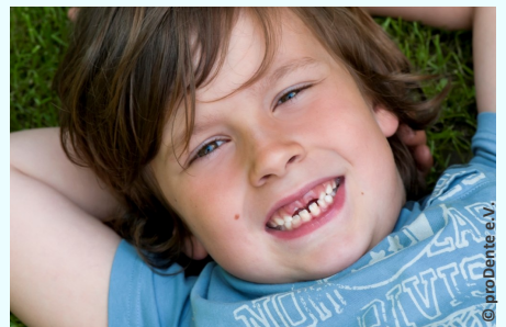
Bei der Prophylaxe lernen Ihre Kinder die richtige Zahnpflege

Es gibt also keinen Grund, warum Sie auf Prophylaxe für Ihre Kinder verzichten sollten.